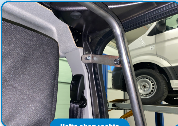
Halte oben rechts