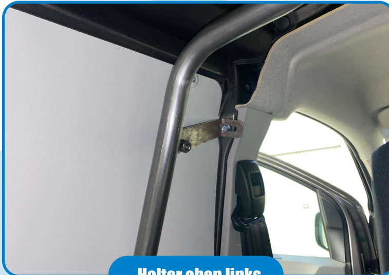
Halter oben links