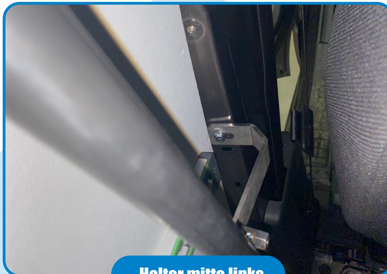
Halter mitte links