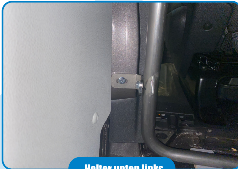
Halter unten links