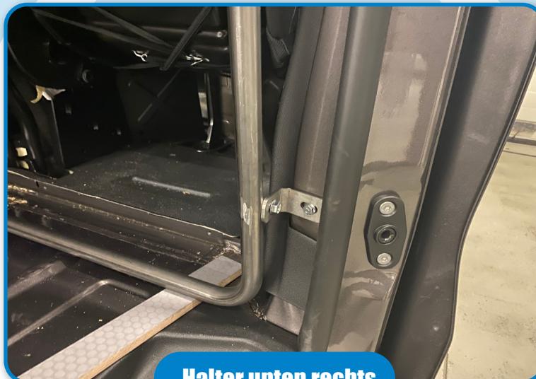
Halter unten rechts